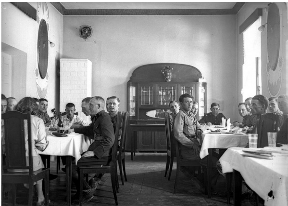
Jedno z wnętrz resursy obywatelskiej w lewej oficynie Zarządu Ordynacji Zamojskiej.

Fotografii dokumentujących architekturę Zwierzyńca jest ponad dwadzieścia.