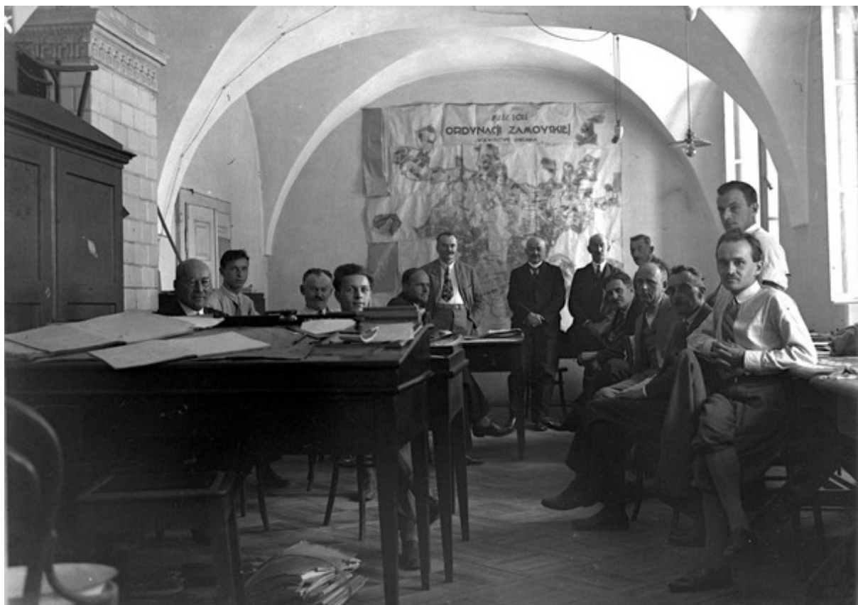
Biuro Zarządu Ordynacji Zamojskiej z pracownikami Wydziału Leśnego. Jedno z wnętrzy resursy obywatelskiej w lewej oficynie Zarządu Ordynacji Zamojskiej.