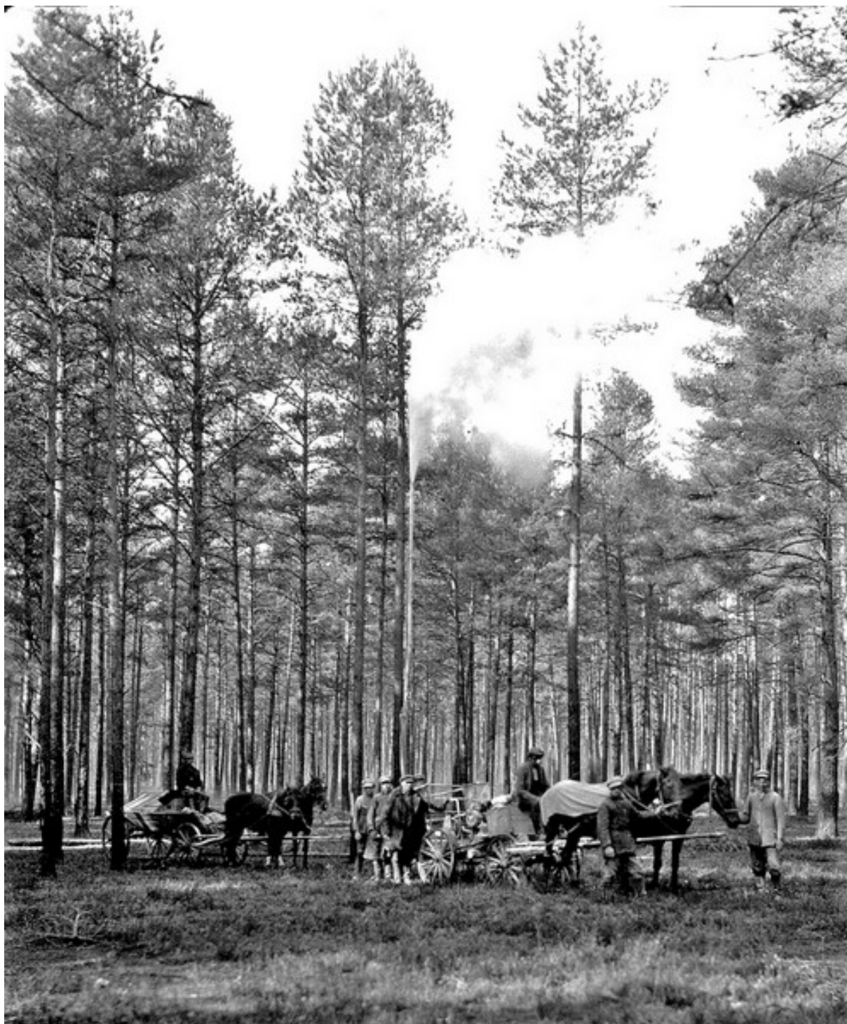
Niszczenie szkodników leśnych.

Ciekawostką pozostaje jedyna fotografia wykonana w Zamościu przedstawiająca pozującą parę młodą w towarzystwie strażaków i drużyny Samarytanek.