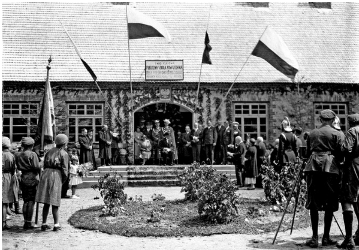
Prezydent Ignacy Mościcki na uroczystości nadania imienia siedmioklasowej Publicznej Szkoły Powszechnej w Krasnobrodzie 07.07.1934 roku.