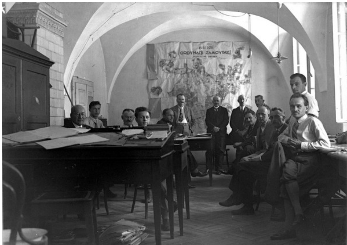
Biuro Zarządu Ordynacji Zamojskiej z pracownikami Wydziału Leśnego. Jedno z wnętrza resursy obywatelskiej w lewej oficynie Zarządu Ordynacji Zamojskiej.