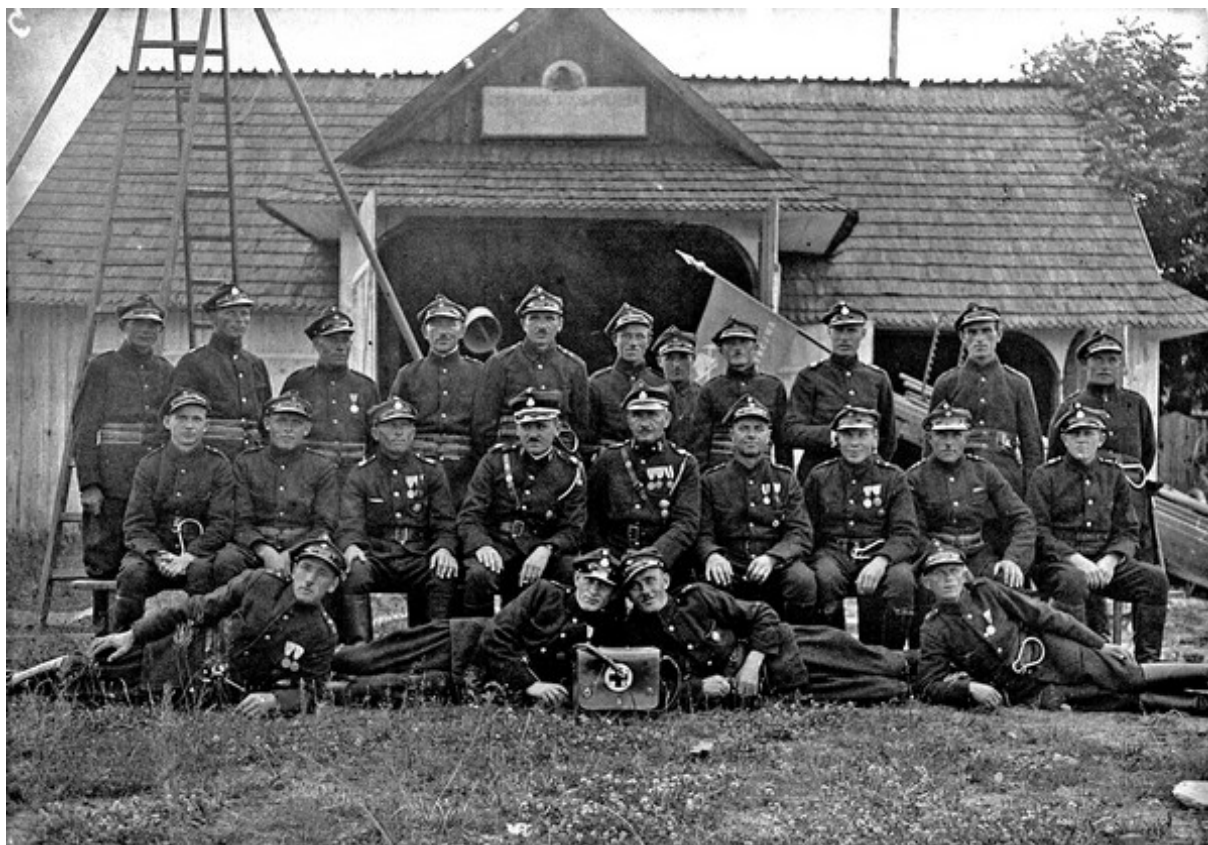
Tartaczna drużyna straży pożarnej Ordynacji Zamojskiej przed budynkiem straży przy tartaku.

Pokaźną grupę stanowi dokumentacja prawdopodobnie zawodów sportowych z okazji Święta Obozu Przysposobienia Wojskowego 9 PPL w Zamościu, które odbyły się w 1938 r. Stawiły się na nie: Związek Strzelecki, Kolejowe Przysposobienie Wojskowe, Przysposobienie Wojskowe Leśników, Związek Rezerwistów. Uczestnicy wykonują skoki w dal, biegi na 100 metrów, trójbój, sztafetę oraz gry zespołowe.