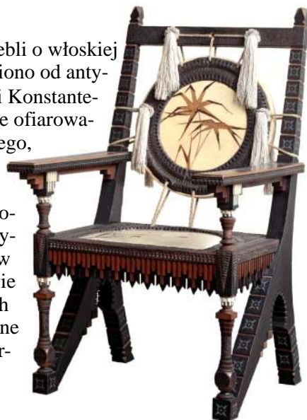
43. Fotel, proj. Carlo Bugatti, ok. 1895-1905 r.