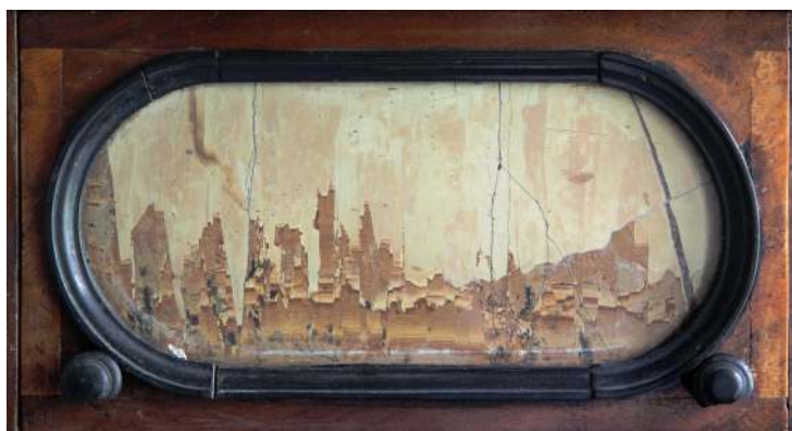
13. Lico szufladki kabinetu, Włochy, 1. poł. XVIII w.

Inny rodzaj wykładania kamieniem nazywany był we Włoszech pietra-paesina , w tej technice podstawowym materiałem był kamień tzw. krajobrazowy. Po dobraniu odpowiedniej kompozycji i przycięciu płytki „włoskiego alabastru” (kalcytu), umieszczano ją w zagłębieniu i oprawiano w profilowane ramki. Dekoracja taka wykorzystana została na lico szufladek w kabiniecie z pierwszej połowy XVIII w. 18 [Fot. 13].