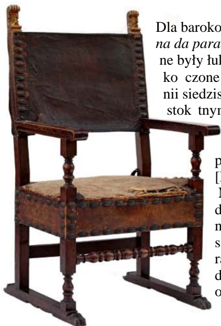
27. Fotel poltrona da parata , Florencja (?) ok. poł. XVI w.

Dla barokowych foteli wywodzących się z typu poltrona da parata , pozbawionych już płóź, charakterystyczne były łukowato wygięte, rozszerzone z przodu i zakończone wydatnymi wolutami poręczami 46 . W Toskanii siedziska takie wytwarzano z tradycyjnymi prostokątnymi, płaskimi, wyściełanymi oparciami. Powstały w Wenecji fotele charakteryzowały się oparciami wyszymi, pełnymi i zwiecznymi falic 47 [Fot. 28].