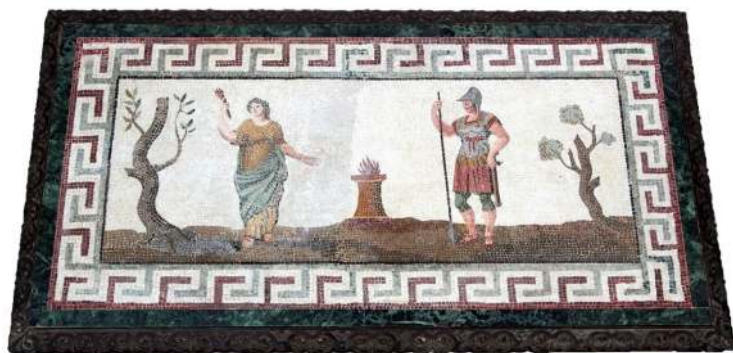
12. Blat stołu, Włochy, 2. poł. XVIII w. (?)