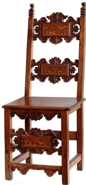
25. Krzesło lombardzkie, pocz. XVII i 2 poł. XIX w.