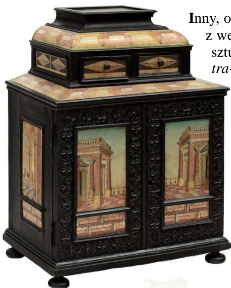
16. Kabinet, Włochy, 4. ćw. XVII w.

Inny, o wiele młodszy kabinet dekorowany jest scagliol [Fot. 16] z wedytami w typie rycin Vincenzo Scamozziego 21 . Ta technika sztukatorska, modna w XVII i XVIII w., polegała na imitacji pietra-dury w kolorowym stiuku. Znana była już w starożytnym Rzymie, rozwinięta została w XVI w. we włoskiej Emilii, jednak najlepsze osiągnięcia należą do Enrico Hugforda, działającego we Florencji w końcu XVIII w. Stiuk wykonywano ze sproszkowanego selenitu, rytowano i malowano jeszcze w mokrej fazie, następnie wygładzano dla uzyskania szklistej powierzchni zabezpieczającej dekorację i upodobił ją do oryginalnej pietra-dury . Ta technika zastosowana została również do wykonania półkolistej blatu klasycystycznej konsoli ze zbiorów MNW 22 , z plecionką wzbogaconą szlakami roślinnymi, ujmując pole rodkowe z czerwonego „granitu”. Innym sposobem było układanie scaglioli z różnokolorowych kostek stiuku.