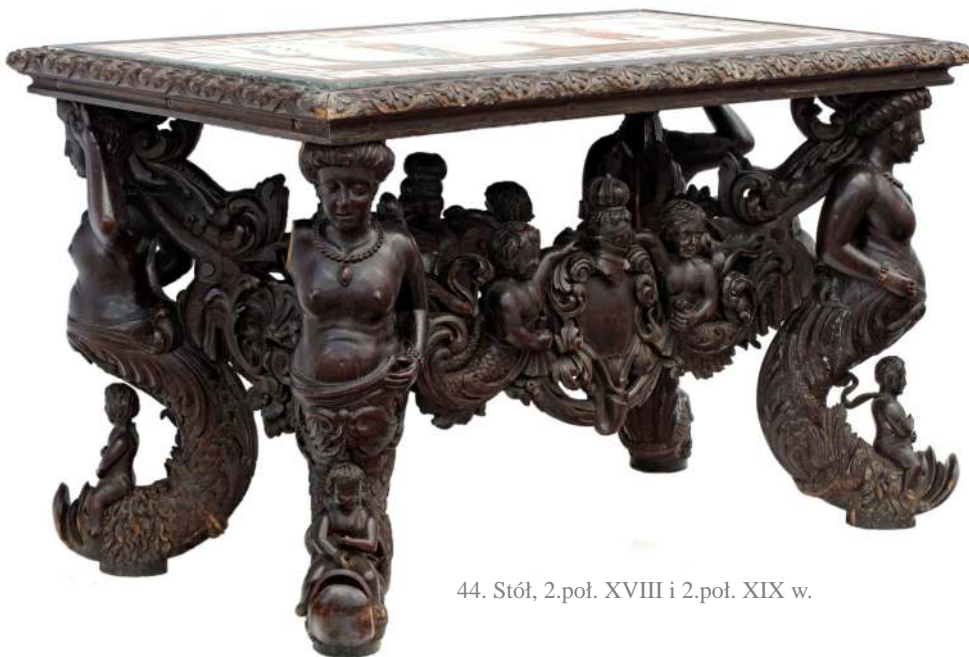
44. Stół, 2.poł. XVIII i 2.poł. XIX w.

Szwajcarii. Pewne egzemplarze mebli budz w tpliwo ci, które mog by rozwiane przy współpracy ze specjalistami z ró nych o rodków i dyscyplin, gdy historykom mebla- rstwa istotn pomoc mog zaoferowa konserwatorzy oraz pracownicy naukowci zajmu- j cy si badaniami fizyko-chemicznymi.