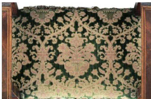
32. Tkanina obiciowa za siedzenia fotela lombardzkiego, Włochy, początek XX w.

Wenecką proweniencją ma również fornirowana orzechem szafka do łóżka lub szafka-postument 67 , o bryle