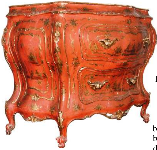
39. Komoda, Wenecja, ok. poł. XVIII w.

Z 3. wiersi XVIII w. pochodzi, przechowywana w zbiorach Muzeum, komoda rokokowa w typie weneckim 79 [Fot. 39], zdobiona imitacją czerwonej laki dalekowschodniej, o ciankach silnie powyginanych w dwóch płaszczyznach, malowana złotem w krajobrazy chijskie ze scenami figuralnymi oraz rzeźbiona w liście akantu i girlandy kwiatowe.