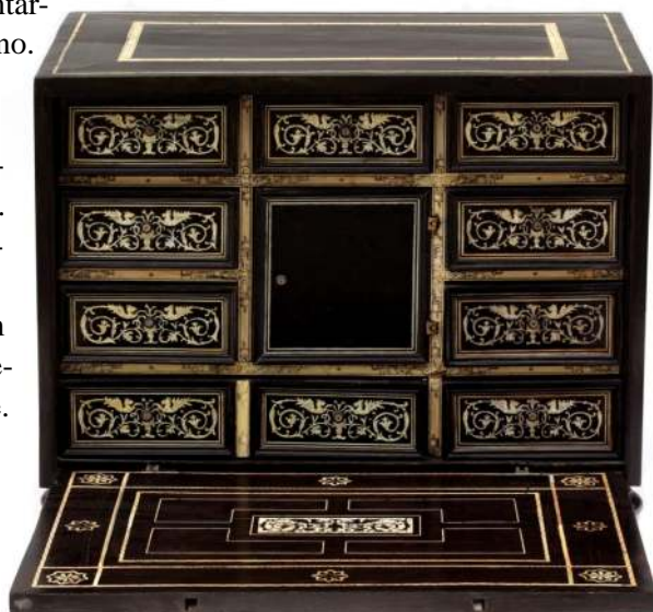
14. Kabinet, Kampania (Neapol ?), poł. XVII w.

Licznym grupą w zbiorach Muzeum stanowi niewielkie kabinety wykładane hebanem lub drewnem imitującym heban oraz inkrustowane kości 19 [Fot. 14], czyli dekorowane z wykorzystaniem techniki analogicznej do intarsji, stosując jednak materiały inne niż drewno. Wśród nich wyróżniają się prostokątne ciemne meble z opuszczanymi kłapkami, mieszczącymi wewnątrz trzy dziesięć szufladek ujmujących tabernakulum z drzwiczkami w formie portyku. Według tradycji był on własnością króla Zygmunta Starego 20 [Fot. 15]. Wśród dekoracji znajduje się kartusz herbowy z Orłem Białym przeplecionym literą „S”, a także przedstawienia figuralne, tzw. storie , m.in. sceny bitewne.