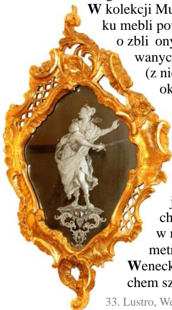
33. Lustro, Wenecja, 3. ćw. XVIII w.