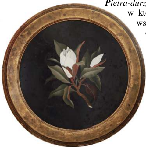
11. Blat stolika, Florencja (?), 2. poł. XIX w.

doki i dekoracyjne obramienia układane były z ró nej wielko ci kolorowych kostek ( tessera ) kamiennych i szklanych. Jedynymi przykładami tej staro ytnej, szlachetnej techniki w zbiorach Działu Mebli MNW s blaty stołów 17 [Fot. 12], według tradycji uznane za pompejskie, zapewne wykonane w 2. poł. XVIII w.