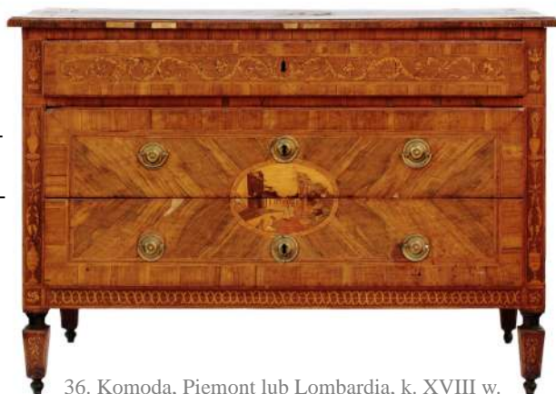
36. Komoda, Piemont lub Lombardia, k. XVIII w.

Kolejne prace włoskich intarsjistów w zbiorach Muzeum pochodzą z schyłku XVIII w. Wiąże ich to komody. Wśród nich