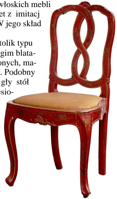
40. Krzesło, Wenecja, 3. ćw. XVIII w.

Do sprężysto prezentujących formy w sposób luźny inspirowane dawną sztuką włoską, jej technikami i motywami zdobniczymi, należy także pochodząca z końca XIX w. czarna szafka dekorowana rzeźbionymi puttami i stworami morskimi, pierwotnie wspierająca pełnoplastycznie ukształtowaną, spięty trzon rzeźbiony o analogicznych formach 86 .