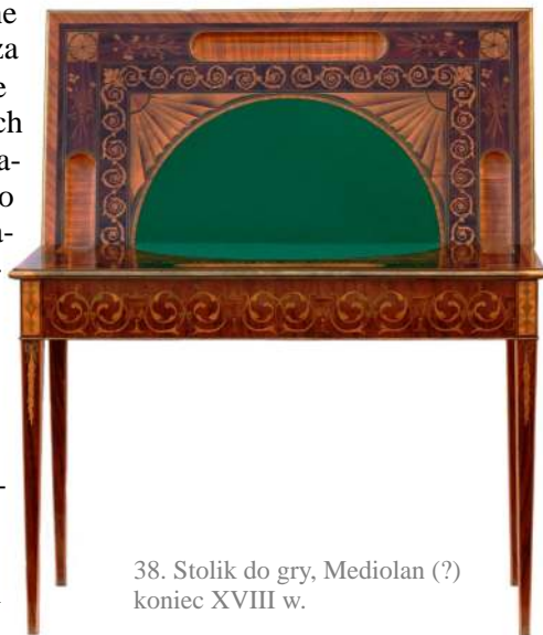
38. Stolik do gry, Mediolan (?) koniec XVIII w.