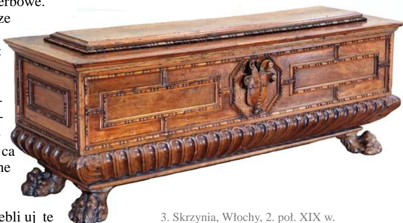
3. Skrzynia, Włochy, 2. poł. XIX w.

Włoskich skrzyni ze zbiorów Muzeum wzbogaconą jest rzeźbionymi ornamentami: roślinnymi, przede wszystkim wiciami, motywami groteskowymi, maskaronami oraz kartuszami [Fot. 4], rzadziej dekoracji figuralnej 7 . Na trzech skrzyniach w typie weneckim 8 z końca XVI w. przedstawienia figuralne rozmieszczone są w owalnych medalionach o obramieniach rollwerkowych. Fronty tych mebli ujęte są w hermami.