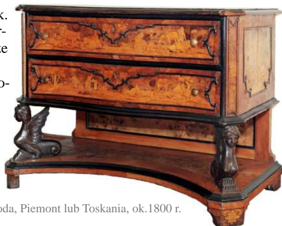
37. Komoda, Piemont lub Toskania, ok. 1800 r.