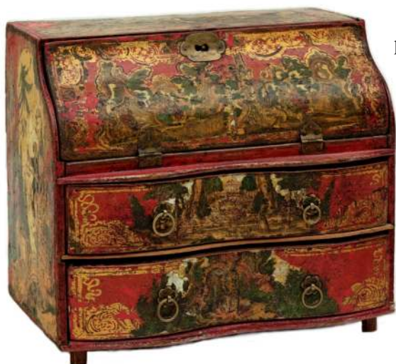
18. Szkatułka, Włochy, 3. w. XVIII w.

Do reprezentacyjnych sprzętów włoskich należą przechowywane w Dziale Sreber i Metali Muzeum Narodowego szkatuły wysadzane rzeźbionymi kamieniami 28 i emaliami 29 oraz kościane kabinety o architektonicznej formie 30 .