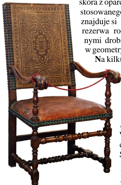
31. Fotel, Toskania (?), 1 poł. XVIII w. skóra obiciowa - 2. poł. XIX w.

Tkanin o włoskiej proweniencji, z drugiej połowy XIX i początku XX w. użyto do obicia kilku mebli, nie tylko włoskich. Wzornictwo tych materiałów nawiązuje do motywów występujących na włoskich aksamitach i adamszkach z XV, XVI i XVII w. Siedzenie jednego z foteli lombardzkich 59 pokryte zostało tkaniną bawełnianą o splecionym wzorze, ze wzorem roślinnym kompozycji sieciowej na aksamitnym tle [Fot. 32]. Tkaniny włoskie z 2. połowy XVI w. o podobnej dekoracji wykorzysty-