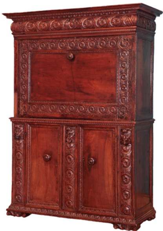
7. Kabinet stipo, Toskania lub Genua, 2. poł. XVI w.

b d szafkowej, zamykane były klapami, po opuszczeniu słupkami do pisania. Z tego typu mebli wywodzą się późniejsze sekretarzyki i sekretery, a przede wszystkim odmiana à abattant .