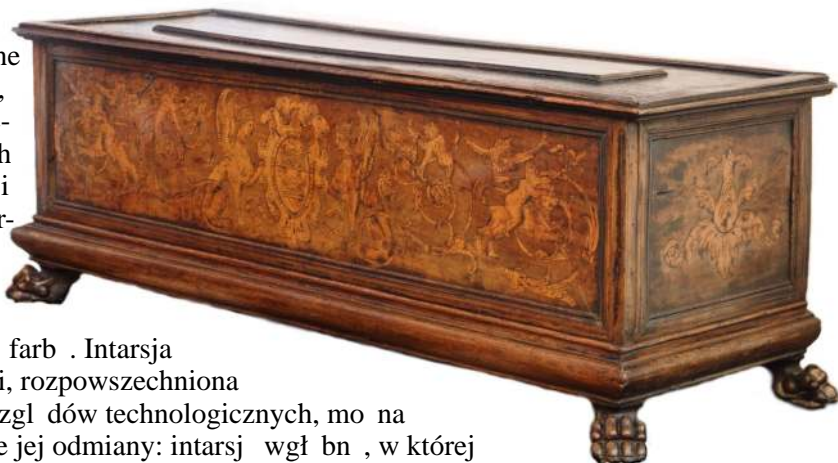
5. Skrzynia, Bolonia (?), kon. XVI w.

Skrzynie włoskie zdobione były także techniką intarsji, polegającą na tworzeniu dekoracji z różnokolorowych gatunków drewna w postaci masywu, obłogu czy też forniuru, czy też wzbogacanej barwieniem, wypalaniem, polichromi, bądź rytowaniem zapuszczanym czarną farbą. Intarsja znana była od starożytności, rozpowszechniona w Europie od XIV w. Ze względu na różnice technologiczne, można wyróżnić dwie podstawowe jej odmiany: intarsję wgłębnią, w której pola tworzące wzór umieszczone były w specjalnie wyciętych wgłębieniach (gniazdach) i okładzinow, zdobiąc wraz z forniowaniem powierzchnię mebla. W przypadku renesansowych skrzyń wykonywanych we Włoszech z masywu orzechowego, przy ozdabianiu wykorzystywano intarsję wgłębnią, zazwyczaj z jasnego bukszpanu. W zbiorach Muzeum ten rodzaj reprezentuje skrzynia w typie bolońskim z końca XVI w., 9 zdobiona na froncie motywami groteskowymi i tarcz herbów oraz kwiatonami na bocznych ciangkach [Fot. 5]. Charakterystycznym włoskim elementem tej i wielu z wymienionych powyżej cassoni są nogi o formie zwierzęcych łap.