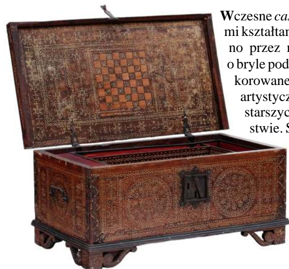
2. Skrzynka, północne Włochy, XIX w.

Wczesne cassoni w typie florenckim charakteryzują się prostymi kształtami. W zbiorach Muzeum reprezentowane są zarówno przez meble nawiązujące do form architektonicznych, o bryle podkreślonej listwowymi podziałami 4 , jak również dekorowane prostymi elementami snycerskimi 5 . Nadawanie artystycznego wyrazu za pomocą rzeźbienia należy do najstarszych technik zdobniczych stosowanych w meblarstwie. Snycerka odgrywała znaczną rolę w renesansie i jeszcze większe znaczenie miała w renesansie, manierze i baroku. W kolejnych okresach stylowych, w zależności od lokalnych tradycji współistniała z innymi rodzajami dekoracji.