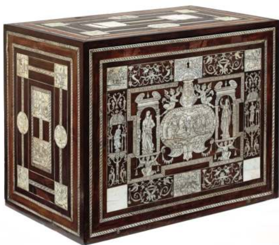
15. Kabinet, Włochy, 1. poł. XVI w.