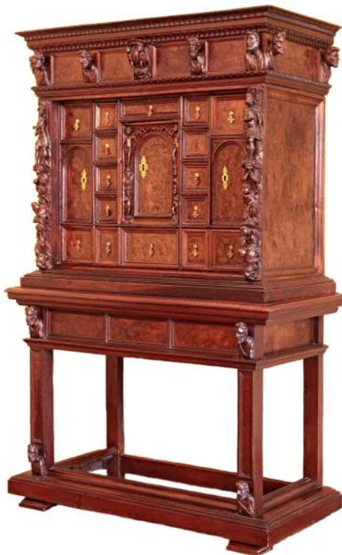
8. Kabinet stipo, Genua, 2. poł. XVI w.

Pochodzący ze zbiorów MNW kabinet o formie sekretarzyka z nastawą, dekorowany widokami malowanymi na marmurze [Fot. 9], powstał ok. 1700 r., prawdopodobnie pod wpływem środowiska rzymskiego 13 . Nastawa z podziałem na centralnie umieszczone