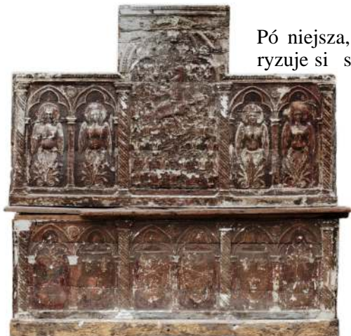
20. Cassapanca, Włochy, XIII-XIV w.

Późniejsza, renesansowa skrzynia-ława z kolekcji Muzeum charakteryzuje się stosunkowo niskim oparciem, równym wysokość poręczom oraz płasko opracowaną dekoracją snycerską 36 [Fot. 21], na którą składają się maskarony, wrole oczy, rozety, a na oparciu ornament zbliżony do puklowania i motywu „biegającej fali”. Najmłodsza odmiana cassapanki ze zbiorów MNW pochodzi z epoki rokoka. Charakteryzuje ją snycerka o motywach rocailles nałożona na skrzyni w kształcie tumbi o esowatych ciankach, jak również na krawędziach i urowego oparcia o falistym zarysie 37 .