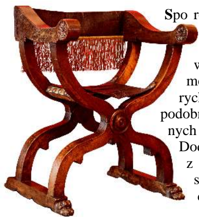
23. Fotel noycowy, Toskania, 1. poł. XVI w.

Spośród krzeseł i foteli najliczniejszy zespół (23 sztuki) stanowi renesansowe siedziska lombardzkie [Fot. 24], zarówno z epoki, jak i zawierające tylko fragmenty oryginalnych mebli oraz w całości wykonane w XIX w. 43 Mają one deskowe siedzenia, graniaste elementy konstrukcji oraz wysokie oparcia proste w linii pleców, których zakończone wolutowate sterzyny boczne ramiaki, podobnie jak nogi, są deskami o brzegach dekorowanych rzeźbionymi wolutowymi ceownicami i esownicami. Dodatkowy element dekoracyjny stanowi w niektórych z nich intarsja z jasnego bukszpanu umieszczona na szerokich deskach spinających ramiaki boczne oparcia oraz łęcznych przednie nogi [Fot. 25].