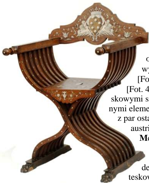
41. Fotel no ycowy, Włochy, ok.1870-1880.

Liczne w zbiorach MNW s neomanierystyczne meble powstałe w drugiej połowie XIX w. (od lat 60-tych), wykładane hebanem lub barwionym na heban drewnem oraz ko ci grawerowan w sceny mitologiczne i motywy groteskowe. Mo na zaliczy do nich: fotel no ycowy 87 [Fot. 41], stół do gry 88 , lustro w owalnej ramie 89 , kabinet 90 [Fot. 42], a tak e dwie pary krzesel 91 z deskowymi siedzeniami i oparciami oraz toczonymi elementami szkieletu. Dekoracji jednej z par ostateczn form nadał znany malarz austriacki Hans Makart 92 .