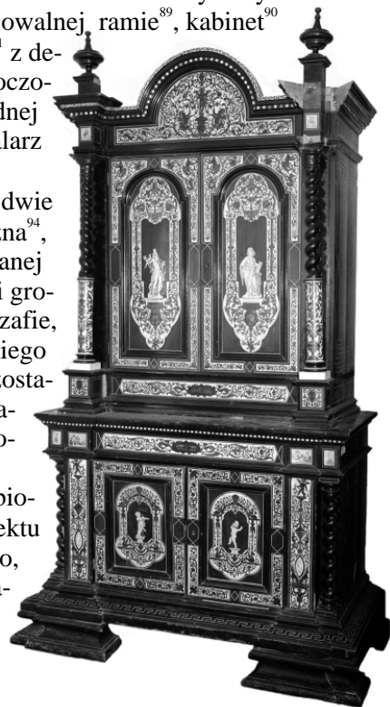
42. Kabinet, Mediolan lub Neapol ok. 1870-1880.