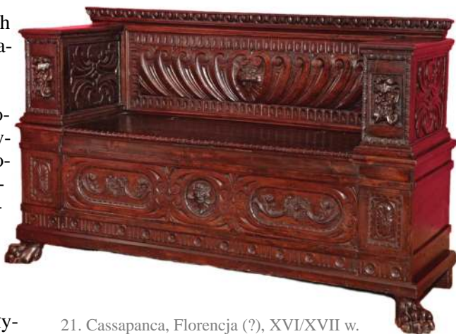
21. Cassapanca, Florencja (?), XVI/XVII w.