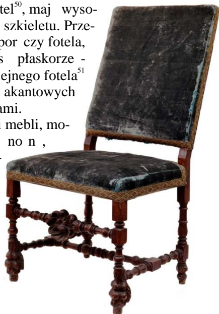
29. Krzesło, Genua, XVII/XVIII w.