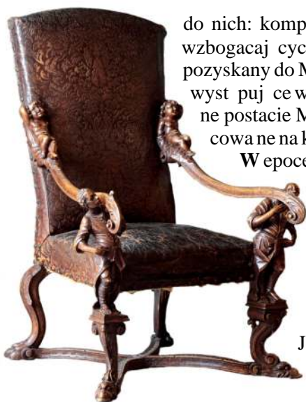
30. Fotel, Wenecja, pocz. XVIII w.

do nich: komplet składający się z dwóch kanap i dwóch foteli 52 [Fot. 30] wzbogacających od lat Antykamer Króla w wilanowskiemu pałacu, oraz fotel 53 , pozyskany do MNW z innego ródła. Typowe dla stylu Andrea Brustolona, występujące we wszystkich siedziakach ze zbiorów Muzeum, pełnoplastyczne postacie Murzynów, putta oraz pozostałe elementy konstrukcyjne opracowane na kształt konarów drzew.