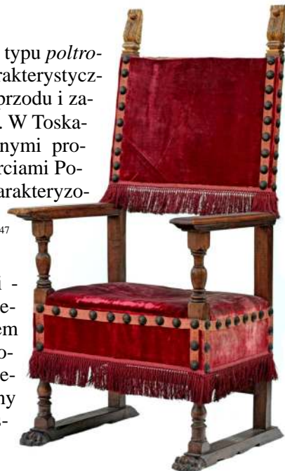
26. Fotel poltrona da parata , Florencja (?) ok. poł. XVI w.

Nieco inna redakcja tego typu siedzisk barokowych powstała w Genui. Charakteryzowała się brakiem sterczynek oparcia, snycerską dekoracją elementów toczonej - przednich nóg i spinającej je łączy oraz zasłonięciem ram oparcia i oskrzy materiałem obiciowym. Do nich należał komplet ze zbiorów Muzeum składający się z fotela i dwóch krzesel 48 , [Fot. 29] powstały na przełomie XVII i XVIII w.