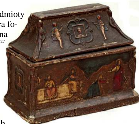
17. Skarbona, Włochy, XIII-XIV w.

Do kategorii małych form meblowych należą również przedmioty naładujące się, jak jedna ze skrzynek nawijająca form do rzeźbionych skrzyń w typie weneckim 25 , wspomniana już skrzynka zdobiona certosin 26 , oraz miniatura sekretery 27 [Fot. 18] z dekoracją typu lacca contrafata . Technikę zwaną lacca contrafatta (laka podrabiana) lub lacca povera (laka dla ubogich) wprowadził do zdobienia mebli na początku XVIII w. Remondino di Bassano. Polegała ona na wycinaniu kolorowanych miedziorytów i przyklejaniu ich na malowaną powierzchnię mebla, a następnie wernikowaniu. Dawało to możliwość szybkiego i taniego wykonywania dekoracji imitujących, w pewnym ograniczonym sposób, lak orientalny, najczęściej jednak malarskie polichromie w guście europejskim. Była ona stosowana głównie w Republice Weneckiej w wieku XVIII.