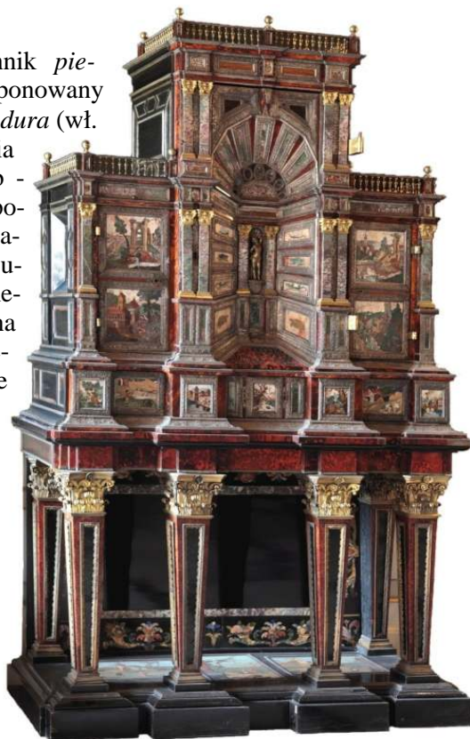
10. Kabinet, Florencja, ok.1670-1700.

Przykładem kabinetów bogato dekorowanych technik pietra-dura jest mebel florencki z ok.1670-1700 r., eksponowany w Muzeum-Pałacu w Wilanowie 14 [Fot. 10]. Pietra-dura (wł. twardy kamie ) to typowo włoska technika zdobienia cian, posadzek oraz mebli i wykonywania blatów, b - d ca odmian mozaiki. Polega ona na wykładaniu powierzchni ró nobarwnymi kamieniami (marmury, alabastry, jaspisy, agaty, malachity, heliotropy, lapis lazuli) wycinanymi we wzory ro linne, zwierze, geometryczne czy te architektoniczne. Technika ta, zwana tak e mozaik florenck , rozpowszechniła si w wieku XVI, głównie w Toskanii, a przede wszystkim we Florencji. Wzory do pietra-dury tworzyli arty ci malarze, a według ich kartonów wykonywała dekoracje „Medicea dele Pietre Dure” (Pracownia Medycejska Pietra Dury). W innym kabinecie ze zbiorów Muzeum Narodowego 15 , o prostopadło ciennej, hebanizowanej nastawie, obok płaskiej dekoracji w technice pietra-dury zastosowano tak e jej odmian reliefow . Pó nym przykładem wykorzystania mozaiki florenckiej, pochodz cym z 2. poł. XIX w., jest okr gły blat stolika z motywem naturalistycznie oddanej gał zki magnolii 16 [Fot. 11].