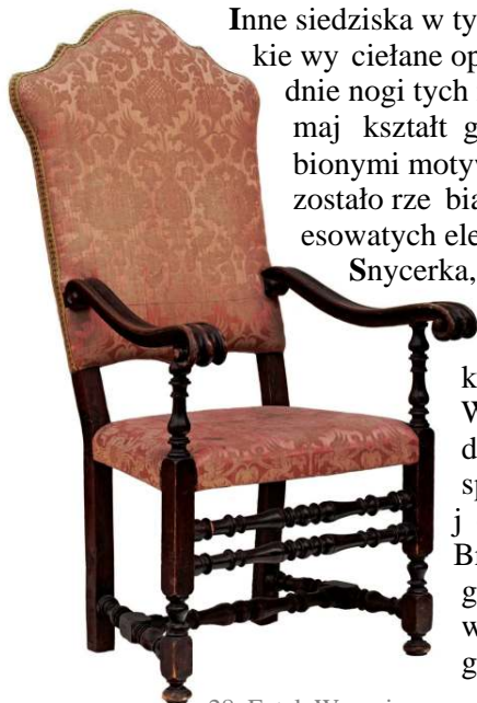
28. Fotel, Wenecja, pocz. XVIII w.

Snycerka, wykorzystywana do dekoracji mebli, mogła też tworzyć ich strukturę, tak działało przede wszystkim w okresie baroku i rokoka. W zbiorach Muzeum przykładami takiego kształtowania sprężystości siedziska nawiązujące do dzieł Andrea Brustolona, słynnego weneckiego stolarza i snycerza, z jego pracami w latach 1662-1732, pracującym również w Rzymie. Należą