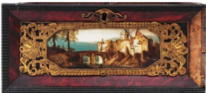
9. Lico szufladki kabinetu, Włochy (?), ok.1700.

tabernakulum flankowane licznymi szufladkami oraz stołowa podstawa powtarzają rozwiązania znane z wcześniejszych okresów. Nowatorskim elementem jest czarna podłoga z pochyloną klapą, po odłożeniu stanowiła blat do pisania i otwierając dostęp do wnętrza i szufladek mieściła przybory pisarskie, papier, bruliony. Rozwiązanie takie rozprószyło się na początku XVIII w.