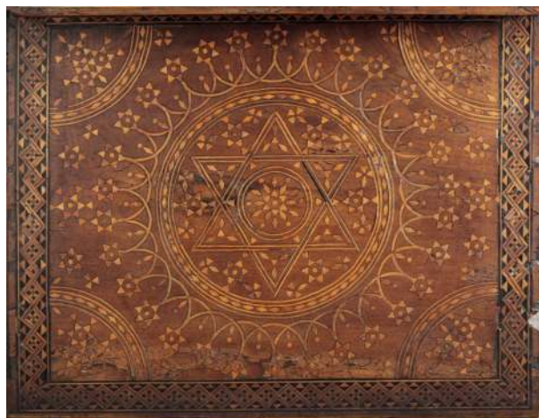
1. Fragment skrzyni, północne Włochy, XV/XVI w. (?)

Do typu XV-wiecznych mebli północnowłoskich nale y wykonana z drewna orzechowego, dekorowana certosin skrzynia na stołowej podstawie o spiralnie skr conych podporach 2 [Fot. 1]. Technik zdobienia tego mebla z punktu widzenia polskiej terminologii zaliczy mo na zarówno do intarsji wgł bnej jak i do wgł bnej inkrustacji. Skrzynia prezentuje charakterystyczne dla certosiny stylizowane wzory ro linne i geometryczne otrzymywane przez wklejanie w specjalnie wyci te gniazda małych kostek ( tessera ) z drewna, ko ci, metalu lub macicy perłowej. Technika ta, wywodz ca si z Bliskiego Wschodu, prawdopodobnie z Damaszku, wzi ła nazw od zakonu kartuzów we włoskiej miejscowoci Certoza. Okres jej popularno ci przypadł na XIV i XV w., najbardziej rozpowszechniona za była w Lombardii, Wenecji i na półwyspie Iberyjskim. W technice tej została te wykonana inna skrzynka, w pomniejszych wymiarach 3 [Fot. 2].