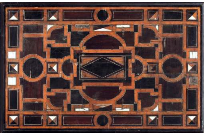
35. Blat stołu, Włochy, XVI/XVII w.

W Muzeum pochodzą z schyłku XVIII w. Wiąże ich to komody. Wśród nich poziomem artystycznym i technicznym dekoracji wyróżnia się grupa trzech cassette w typie mediolańskim, z końca XVIII w., w manierze Giuseppe Maggioliniego 71 [Fot. 36], projektanta i stolarza prowadzącego w latach 1770-1814 pracownię w Parabiago pod Mediolanem 72 . Meble Maggioliniego, jak również te z jego form i ornamentyki komody ze zbiorów Muzeum charakteryzują: prostokątne kształty, graniaste, zbite nóżki, bogata intarsjowana dekoracja o motywach wicirolinnej i groteskowych, a także okrągłe lub owalne rezerwy umieszczone na bokach korpusu oraz po rodunku pola utworzonego z lic dwóch dolnych szuflad, zawierające przedstawienia krajobrazowe lub rodzajowe.