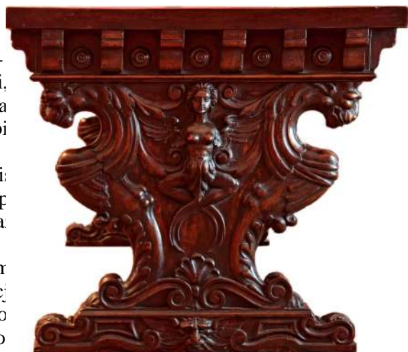
19. Stół, Florencja (?), 2. poł. XIX w.

Skrzynia-ława, zwana cassapanca , konstrukcją i formą różni się od skrzyni, z której przejęła pierwotną funkcję: przechowywanie. Przystosowana została do pełnienia roli siedziska poprzez dodanie oparcia oraz poręczy. Do tego typu należy najstarszy mebel ze zbiorów Muzeum Narodowego w Warszawie - XIII/XIV - wieczna cassapanca z wysokim oparciem, jeszcze bez wykształconych poręczy lub boków, z malowanymi sztukateriami 35 [Fot. 20]. Dekorowana jest ostrołukowymi arkadami ze spiralnymi kolumnami, wypełnionymi tarczami herbowymi i postaciami aniołów.