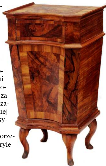
34. Szafka, Wenecja, ok. poł. XVIII w.