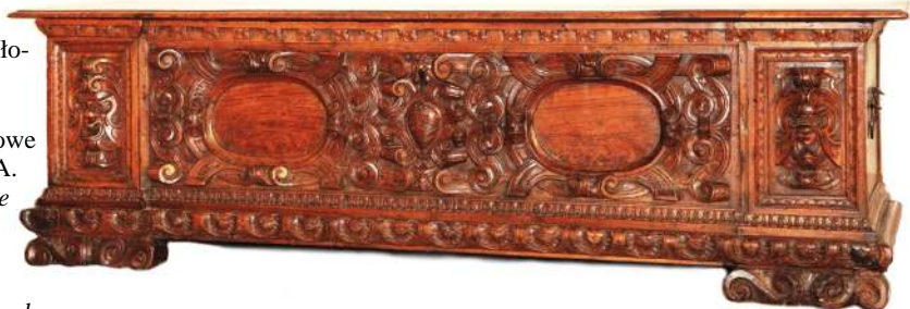
4. Skrzynia, Wenecja, 2. poł. XVI w.