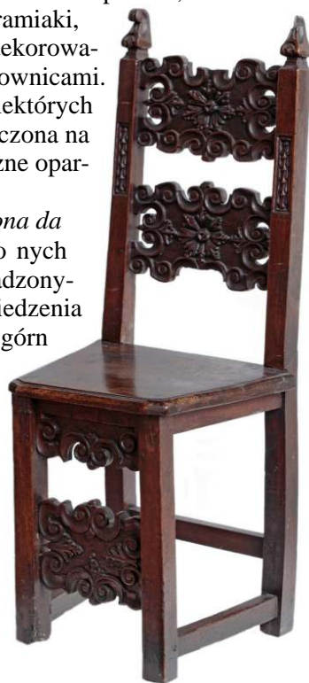
24. Krzesło lombardzkie, XVI/XVII w.

Do typu mebli siedziskowych pochodzących z początku XVII w. należą w zbiorach Muzeum dwa fotele o wyściełanych skórą siedzeniach, graniastych elementach konstrukcji, ramiakach oparzeniowych w górnej partii pasami skóry oraz nogach od frontu i z tyłu połączonych szerokimi geometrycznymi plecionkami 45 . Siedziska takie wytwarzane były zarówno we Włoszech, jak w Hiszpanii i Portugalii, dlatego też bez przeprowadzenia szczegółowych badań niemożliwe jest stwierdzenie ich proveniencji. Fotele typu da parata , które zaczęto wytwarzać w okresie renesansu, w baroku przekształcone zostały w siedziska o przewadze elementów toczonych nad graniastymi. Toczenie było ważną techniką kształtowania części szkieletu, w tym nośnych, znaną w Europie już około 2700 lat temu. Zazwyczaj toczonymi podzespołami meblarskimi były nogi, wszelkiego rodzaju łęczny, porczy, ramiaki oparzeniowe w siedziskach, sterzyny, a także uchwyty gałkowe zwane knopikami. Toczony element szkieletu czysto dodatkowo opracowywano snycersko.