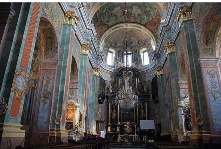
10. Lublin. Wnętrze archikatedry (dawniej kościoła Jezuitów) po renovatio w latach 1756–1758.