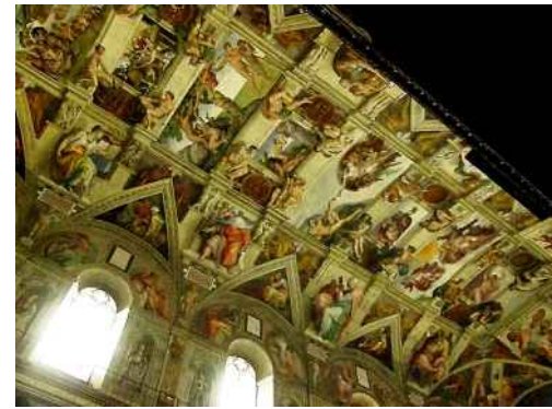
26. Rzym. Fragment wnętrza kaplicy Sykstyńskiej po konserwacji w l. 1980-1989.

Przy dużych pochwałach wobec działań włoskich konserwatorów, można im także zazdrościć 92 . Takim „zazdroczeniem” była realizowana w latach 2002-2004 kompleksowa konserwacja kaplicy Zygmuntovej na Wzgórzu Wawelskim w Krakowie. Do diagnostyki i konserwacji kaplicy Międzyuczelniany Instytut Konserwacji i Restauracji Dzieł Sztuki oraz Instytut Optoelektroniki