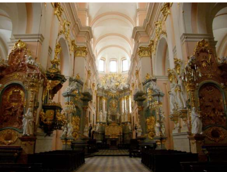
8. Miechów. Wnętrze gotyckiego kościoła (dawniej Bożogrobców) po renovatio w XVIII w.