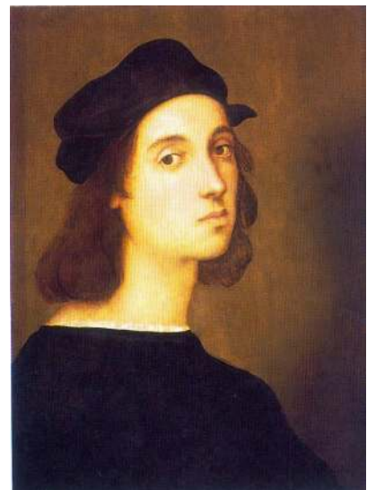
6. Rafael Santi. Autoportret konserwatora rzymskich starożytności, 1506 r.

W czasach papieża Leona X (Giovanniego de' Medici), opiekuna poetów i artystów, od 1 VIII 1515 r. funkcję Inspektora d.s. Pięknych Sztuk (Ispettore di Belle Arti), odpowiadającemu urzędowi konserwatora, spełniał przy papieżu Rafael Santi z Urbino (1483 – 1520) 25 .