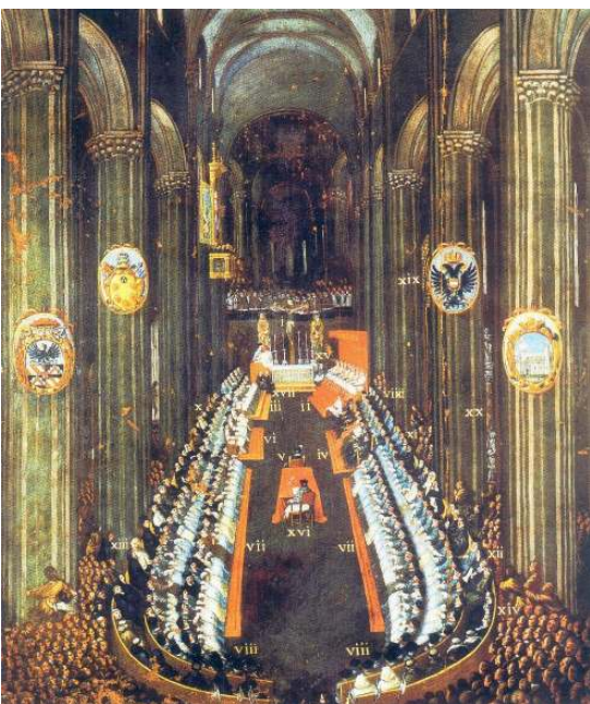
7. Trydent. Wnętrze katedry podczas ostatniej sesji soboru w 1563 r.

Sobór trydencki dekretem przyjął tym na ostatniej 25. sesji, która odbyła się w dniach 3 i 4 XII 1563 r., za czasów pontyfikatu wspomnianego już Piusa IV, ocalił dla kultury wiatowej dzieła sztuki dawnej i uzasadnił teologicznie możliwość rozwoju sztuki w przyszłości 32 . Podstawowe dokumenty soborowe odrzucając idee reformacji i obrazoburstwa, wprowadziły kompleksowy program naprawy Kościoła katolickiego. Celem naprawy miało służyć kształtowanie pozytywnego stosunku Kościoła do własnej bardzo długiej historii, o której niezniszczalności miały świadczyć starożytnie budowle sakralne i dzieła sztuki. Obowiązek restauracji budowli został zdecydowanie podkreślony w dokumentach soboru 33 . Zapisano również, że obrazy Chrystusa, Bogarodzicy Dziewicy i innych w tych winny być umieszczane i zachowywane w kościołach (...) a jeżeli im okazująca odnosi się do prawzorów, które one przedstawiają 34 .