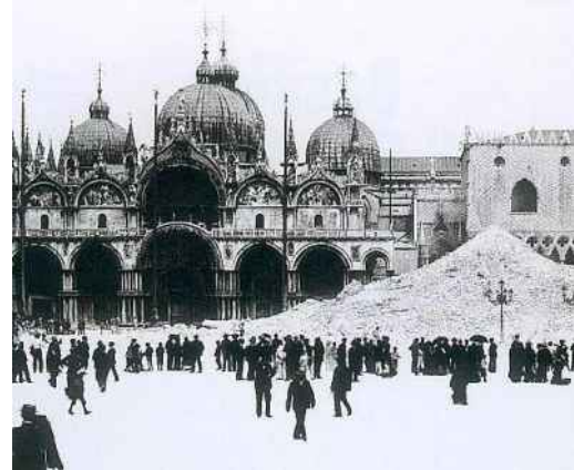
17. Wenecja. Plac Św. Marka, 14 VII 1902 r., w chwilę po niespodziewanym rozpadnięciu się Kampanili.

Realizuj c zapisy Ate skiej Karty, w tym samym czasie, powstała Włoska Karta Konserwacji Zabytków (tzw. Karta Rzymska) uchwalona przez Rad Najwy sz do spraw