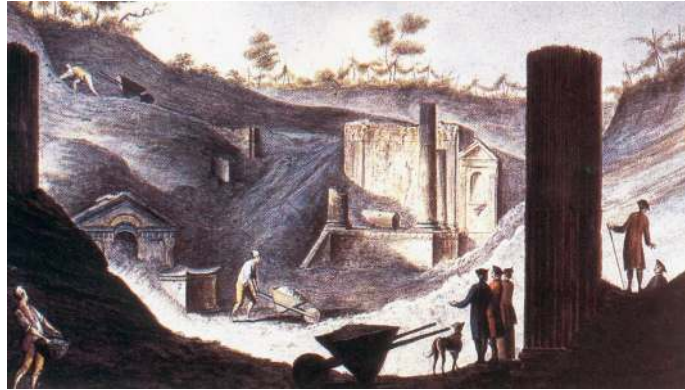
14. Pompeje. Prace wykopaliskowe przy świątyni Izdydy na grafice z XVIII w.

Dzieło Winckelmanna – niemal przez całe swoje życie związane z Rzymem i jego „starożytnościami” – ukazało się w Dreźnie i spowodowało narodziny współczesnej archeologii 56 . Potocki wydał je w swobodnym tłumaczeniu w 1815 r. w trzech tomach pod tytułem: O sztuce u dawnych, czyli Winkelmann polski 57 . Ambitnym zadaniem