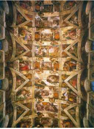
25. Rzym. Fragment sklepienia Sykstyńskiej przed konserwacją.

Mogłoby się stwierdzić, że prace prowadzone od 1994 r. kompleksowe prace konserwatorskie przy wystroju wnętrza kościoła akademickiego św. Anny w Krakowie, który to wystrój jest wspaniałym dziełem Baltazara Fontany, byłyby mi o mieleni dobrym przykładem wcześniej zakończonej konserwacji Sykstyńskiej.