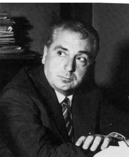
20. Cesare Brandi.