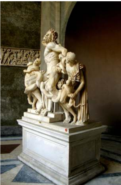
5. Rzym. Muzea Watykańskie. Dziedziniec Belwederski – „Grupa Laoköona” odkryta w 1506 r.

powszechnie zapełniły się starożytnymi posągami, a studia nad antykiem w ciszej i czynie w tym mieście i jego topografii przeobraziły się stopniowo w odrębny gałąź wiedzy 19 . Z tego ruchu wywodzi się początki konserwatorstwa jako samodzielnej dziedziny naukowej. W tym czasie papież Juliusz II stworzył podwaliny pod obecne Muzea Watykańskie, dokonując zakupu w pierwszych miesiącach 1506 r. wspomnianej grupowej rzeźby antycznej „Laoköona z synami”. Ta rzeźba oraz Apolla Belwederskiego i tzw. Tors Belwederski papież polecił ustawić wówczas na dziedzińcu Belwederskim (zaprojektowanym przez Bramante) w pałacu Watykańskim 20 .