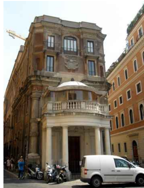
15. Rzym. Fasada frontowa pałacu Zuccariego. Pod portykiem polskie herby królewskie: Orzeł i Pogoń oraz herb Janiny Sobieskich i margrabiów d'Arquien.

Na przełomie wieków XIX i XX szczególnie aktywna była szkoła wiedeńska 69 . Niemniej, teoria Riegla i Dvořáka stanowiła odzwierciedlenie, a nawet rozwinięcie poglądów wyrażonych wcześniej przez włoskiego architekta, historyka sztuki i pisarza Camilla Boito (1836–1914).