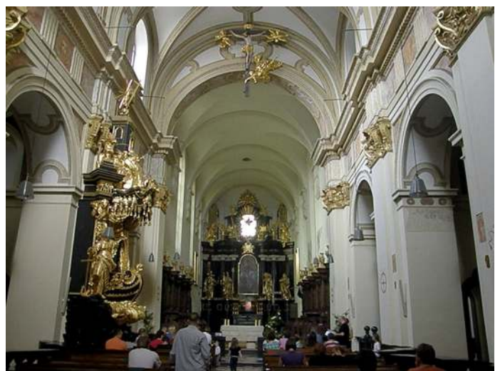
9. Tyniec (ob. Kraków – Tyniec). Wnętrze romańsko-gotyckiego kościoła Benedyktynów po renovatio w wiekach XVII i XVIII.