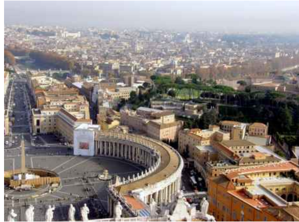
21. Rzym. Fragment panoramy miasta z kopuły Bazyliki św. Piotra.

Wielki wrażliwy wiecie – w pozytywnym tego słowa znaczeniu – odnoszą spektakularne „kompleksowe” konserwacje podejmowane w Wiecznym Mieście i w stolicy Toskanii. Wystarczy wspomnieć konserwację fresków w Kaplicy Sykstyńskiej, Piety Michała Anioła w Bazylice św. Piotra na Watykanie czy Dawida w Gallerii dell'Accademia we Florencji. Nagłaśniając prace konserwatorskie Włosi z jednej strony podkreślają, że są szczególnie predestynowani do realizacji kreatywnych aktów konserwatorskich, a z drugiej – wzbudzają zainteresowanie zabytkami