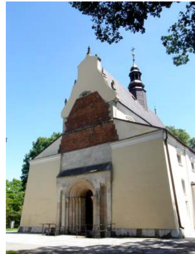
11. Kościół Proszowicki. Fasada zachodnia XIII-wiecznego kościoła p.w. św. Wojciecha po renovatio w XVII w.

Późnoromański kościół p.w. w Wojciecha z lat 1229–1242 zyskał nowe oblicze w latach 1628–1673 46 . Przekształceniu uległy wówczas wnętrza i elewacje zewnętrzne (ściany boczne wymurowano od nowa). Powstał nowy podział ścian, „dano” nowe sklepienia w miejsce stropów drewnianych, powiększono okna a zachodni fasadę ozdobił bardzo smukły szczyt. Z pierwotnej budowli zachowano ściany prezbiterium i nawy głównej, w których aneksy przyprezbiterialne oraz najważniejszą część zachodniej ściany nawy głównej wraz z osadzonym w niej znakomitym, późnoromańskim trójskokowym portalem. Ponieważ zachowano ściany nawy głównej, szczytliwie dotrwał do naszych czasów romański układ emporowego korpusu trójprzęsłowego. I choć najważniejsze, w triforialnych przelotach sześciu arkad empor przetrwał komplet dwunastu głowic kolumniowych, podtrzymujących archadę przełotową pomiędzy nawą główną a niższymi nawami bocznymi 47 .