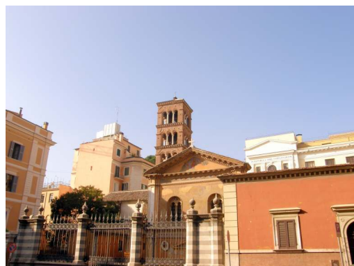
1. Rzym. Kościół św. Pudencjany przy via Urbana.

W tym okresie przeniesiono w Rzymie na samego Chrystusa tytuł „konserwatora”, w starożytności przyznawany niektórym bóstwom antycznym i rzymskim cesarzom 2 . W kościele w Pudencjany, dawnym i dobrze zachowanym titulusie Pudensa – rzymskiego senatora 3 , w absydzie znajduje się mozaika z przełomu IV i V w. Na tej mozaice Chrystus mówi o sobie, że jest konserwatorem kościoła znajdującego się w domu Pudensa, bowiem bazylika stała na miejscu jego domu. Konserwatorem czyli tym, który zachowuje, ocala i zapewnia dalsze istnienie 4 .