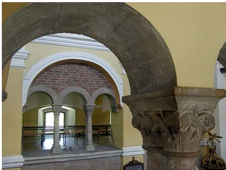
13. Kościelec Proszowicki. Fragment wnętrza kościoła. Doskonale zachowane tryforia arkad empor.