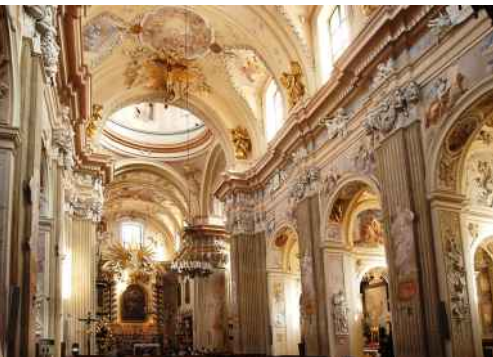
27. Kraków. Wnętrze kościoła akademickiego św. Anny po pracach konserwatorskich w l. 1994-1999.