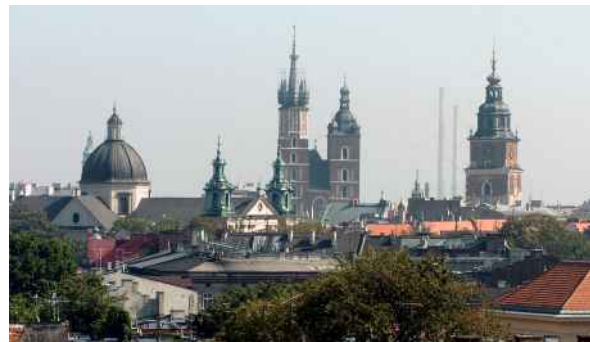
23. Kraków. Fragment panoramy miasta zeszpeconej przez kominy i wieże elektrociepłowni w Łęgu, wg lokalizacji z 1961 r.

Na przykładzie wspomnianych miast widać, że w jednej dziedzinie Włosi radzą sobie znakomicie. Niemal jako jedynym na świecie udaje im się skutecznie chronić historyczny krajobraz kulturowy. Panoramy Rzymu i Florencji nie są skażone na przestrzeni ostatnich lat wysoko ciowcami oraz aktualnie nie obserwuje się