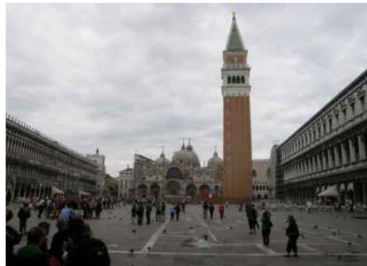
18. Wenecja. Plac Św. Marka w czerwcu 2008 r. Kampanilę odbudowano w l. 1904–1911 „tak jak wyglądała i tam, gdzie stała”.