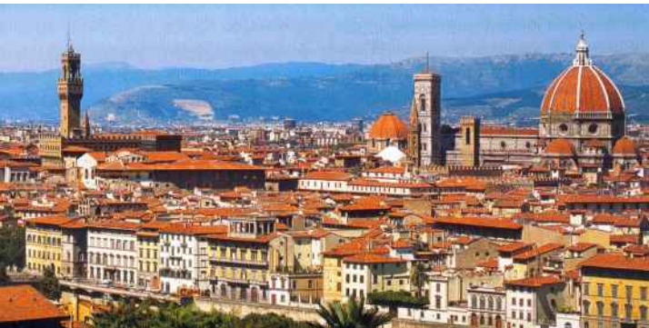
22. Florencja. Panorama miasta z piazzale Michelangelo.

Rzym i Florencja to wielkie muzea pod gołym niebem, w nich skupia się wiele problemów związanych ze współczesną konserwacją i ochroną zabytków, chociaż oczywiście w innych, równie wspaniałych miastach włoskich podejmuje się stałe różnego rodzaju prace zabezpieczające i konserwatorskie 88 .