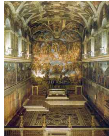
24. Rzym. Wnętrze kaplicy Sykstyńskiej przed konserwacją.