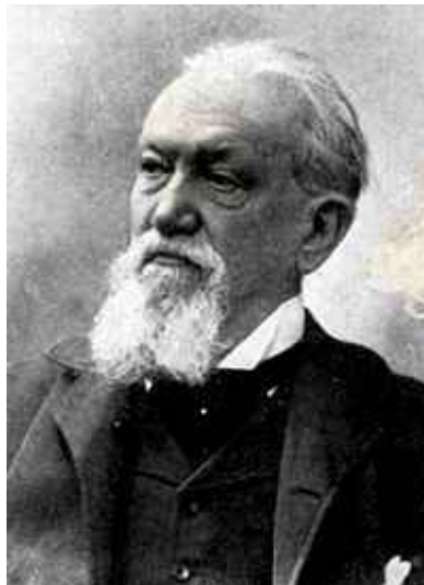
16. Camillo Boito.

Na III Konferencji Architektów i Inżynierów Budownictwa w Rzymie w 1883 r. Camillo Boito był autorem siedmiu podstawowych zasad do praktycznego stosowania przez ówczesnych urzędników sprawujących nadzór nad zabytkami. Na pierwszym miejscu zalecił umacnianie i naprawianie czyli konserwację zabytków, a dopiero w ostateczności restaurację ze stosowaniem dodatków i innowacji. W przypadku gdyby takie innowacje okazały się całkowicie niezbędne, wówczas winny by były wykonane odmiennie niż całość zabytku, z tym, aby w widoku ogólnym nie odbijały się zbyt rażąco od ogólnego wyrazu artystycznego obiektu 72 . Jak przystało na kontynuatora tradycji włoskich, rozpoczął tych przez Rafaela, Boito domagał się: aby przed przystąpieniem do jakichkolwiek, nawet najdrobniejszych prac naprawczych lub konserwatorskich wykonywano zdjęcie zabytku, następnie, w miarę postępu robót, zdjęcia poszczególnych ich faz, a wreszcie zdjęcie obiektu ukończonego. Takie zdjęcia mają być przysyłane do Ministerstwa Oświecenia Publicznego wraz z rysunkami planów elewacji, rzutów i detali (...), na których zaznaczone będą z największą dokładnością wszystkie fragmenty zachowane, umocnione, przerobione, odnowione, zmienione, przeniesione lub zburzone. Rysunki i zdjęcia zaopatrzone będą w dokładne i merytoryczne sprawozdania opisowe, zawierające uzasadnienie i opis wykonanych prac oraz wszelkiego rodzaju wprowadzonych zmian 73 .